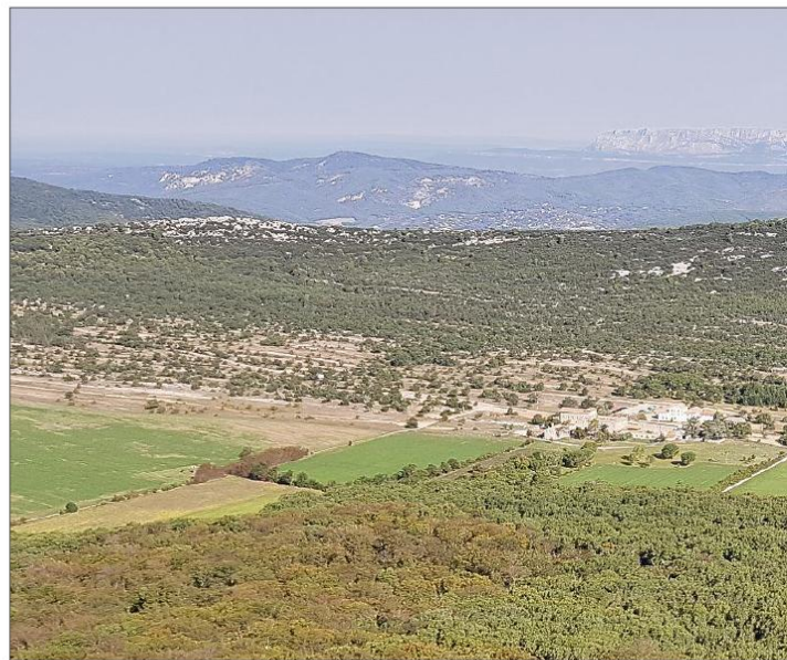
Vaste de 2076 hectares, la forêt domaniale de la Sainte-Baume s'étend entre la barre rocheuse et l'hostellerie située au Plan-d'Aups.