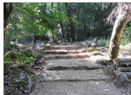
Le chemin du Coussin est l'un des sentiers d'accès à la grotte Sainte-Marie-Madeleine.